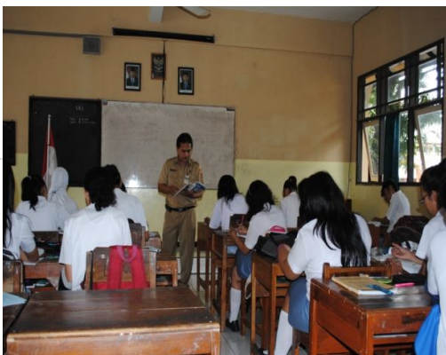
Contoh Kegiatan Kelas Tahap BKOF