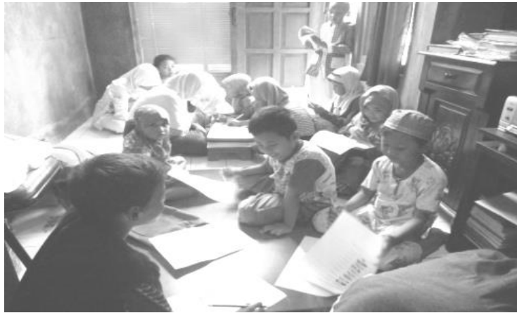
Gambar 4. Pre-test