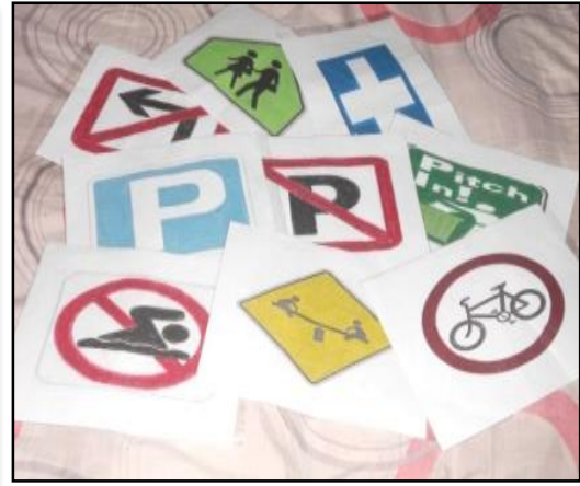
Gambar 2: Kartu gambar