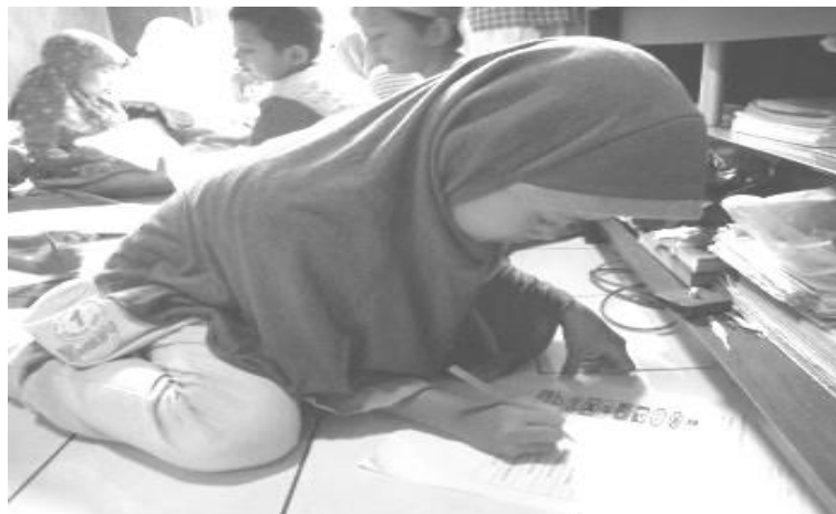
Gambar 6. Post-test