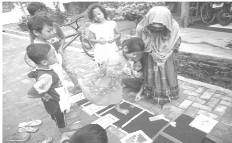
Gambar 5. Praktik