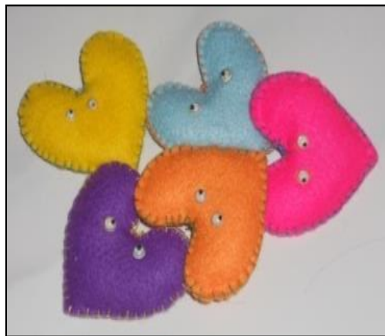
Gambar 3: Gacuk PORTEK

Halangan untuk dapat bermain di dalam ruang pada saat hujan menjadi salah satu penyebab lahirnya media belajar PORTEK ini. Modifikasi yang dilakukan penulis adalah dengan mengubah bidak engklek yang pada versi asli digambarkan di atas sebidang tanah dengan bantuan ranting atau batu kecil menjadi lembaran karpet tebal berwarna merah yang berpola sama seperti bidak engklek versi asli model pesawat terbang. Model ini dipilih karena jumlah bidaknya paling banyak di antara model bidak engklek lainnya. Selanjutnya, pada setiap bidak PORTEK ditempatkan gambar tanpa ada satu huruf pun tertulis di gambar tersebut. Langkah permainannya sama seperti permainan engklek pada umumnya.