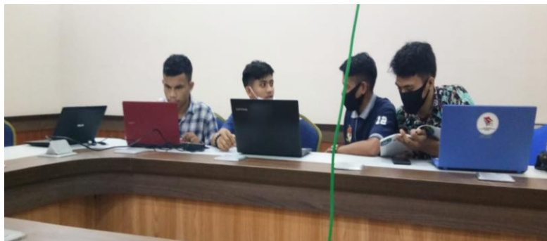
Gambar 1. Suasana Pelatihan

Kegiatan pengabdian kepada masyarakat ini mendapatkan sambutan yang sangat positif dari peserta ini dikarenakan program ini sesuai dengan kebutuhan mereka untuk menjadi mahasiswa yang produktif dalam membuat media pembelajaran. Pelatihan ini di ikuti oleh para mahasiswa program studi pendidikan jasmani yang berpartisipasi secara aktif dalam mengikuti seluruh proses kegiatan. Suasana Pelatihan ini dapat dilihat pada gambar 1.