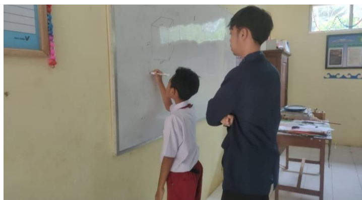
Gambar 4.4 Aktivitas siswa saat sedang berdiskusi

Pertanyaan yang dibuat sesuai dengan materi yang sedang dipelajari. Saat berlangsungnya proses diskusi, diberikan motivasi kepada siswa dengan berkata " setiap individu harus berperan aktif dalam membahas soal, dan tidak boleh mengandalkan temannya".