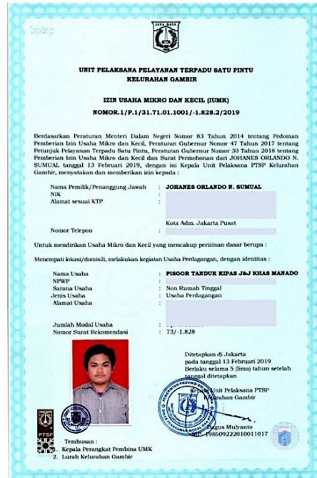
Gambar 1. IUMK dari PTSP

IUMK seperti yang terlihat pada Gambar 1, diperoleh dengan cara mendatangi kantor PTSP untuk mendaftarkan usaha mikro atau usaha kecil. Selain itu pelaku usaha wajib mengikuti pelatihan kewirausahaan dari pihak Kelurahan atau Kecamatan setempat.