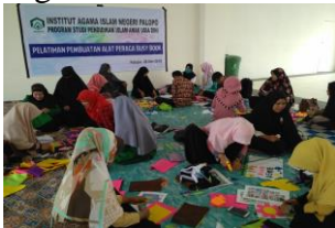
Gambar 4. Para Peserta Sedang Membuat Busy Book

Busy Book yang dibuat guru dalam pelatihan ini. Pada Tabel 1 dapat dilihat bahwa sebanyak 17 peserta (85%) dapat membuat Busy Book sesuai dengan kriteria yang ditetapkan. Angka ini merepresentasikan bahwa mayoritas peserta telah mampu membuat Busy Book dengan baik melalui pelatihan yang telah diikuti.