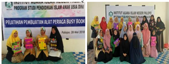
Gambar 5. Prakarya Para Peserta

Apabila diperhatikan, pada Tabel 1 terlihat bahwa membuat Busy Book dengan desain fungsional seperti kriteria paling sulit untuk dicapai. Kriteria ini hanya berhasil dicapai oleh 15 orang. Berbanding terbalik dengan degradasi warna Busy Book . Itu artinya, cukup mudah membuat Busy Book terlihat menarik dengan degradasi mencolok (menarik), tetapi tidak fungsional. Percampuran warna dari bahan yang berbeda menyebabkan peserta kesulitan merangkainya. Semakin banyak warna, semakin banyak kain flanel dalam ukuran kecil yang dijahit. Hal ini tentu ada bagian-bagian penting yang tidak diperhatikan sehingga komponen Busy Book mudah terlepas dan copot begitu saja. Di samping melihat hasil penilaian prakarya peserta, perlu juga untuk memperhatikan hasil observasi mengenai keterlibatan (peran aktif) peserta saat pelaksanaan pelatihan.