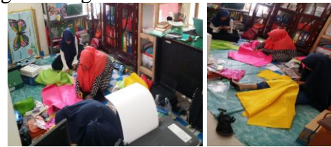
Gambar 3. Panitia Membantu Para Guru Menyediakan Alat dan Bahan yang Digunakan dalam Pelatihan

yang diberikan oleh pemateri yaitu (1) bagaimana merancang pembelajaran menggunakan Busy Book , (2) bagaimana mendesain busy book yang sesuai untuk anak, dan (3) bagaimana membantu guru dalam menuangkan berbagai aktivitas sehari-hari baik di rumah dan di sekolah ke dalam Busy Book serta bagaimana melakukan pembiasaan pada anak mengikuti alat peraga Busy Book yang dibuatnya. Selanjutnya, pada proses pelatihan pembuatan Busy Book , guru diarahkan untuk menyiapkan alat dan bahan yang akan digunakan.