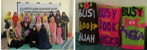
Gambar 6. Hasil Akhir Produk Busy Book dari Para Peserta

secara lengkap. Jumlah pendamping yang memadai, juga memberikan aksesibilitas yang baik bagi peserta untuk meminta bantuan ketika menjahit antar flanel, ukuran potongan flanel, teknik memanaskan lem serta aspek lain yang mempengaruhi kinerja para peserta.