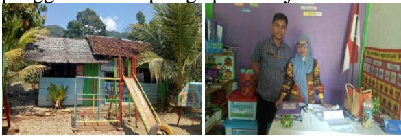
Gambar 2. Panitia Melakukan Pemetaan Masalah Para Guru di Lapangan (Lembaga TK)

Selanjutnya, tahap observasi dan identifikasi masalah di lapangan digunakan untuk melakukan pemetaan. Dalam pemetaan ini, panitia mendatangi satu persatu lembaga TK yang dianggap memiliki masalah dengan penggunaan alat peraga pembelajaran.