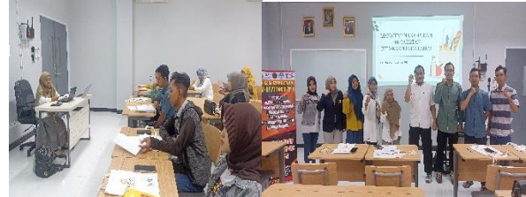
Gambar 2 : pelatihan manajemen keuangan

bisnis. Hasilnya, UKM Jenang tersebut dapat meningkatkan efisiensi operasional, meminimalkan risiko keuangan, dan membuka peluang lebih besar untuk akses pembiayaan serta ekspansi pasar, sehingga mampu berkontribusi lebih signifikan terhadap perekonomian daerah dan nasional.