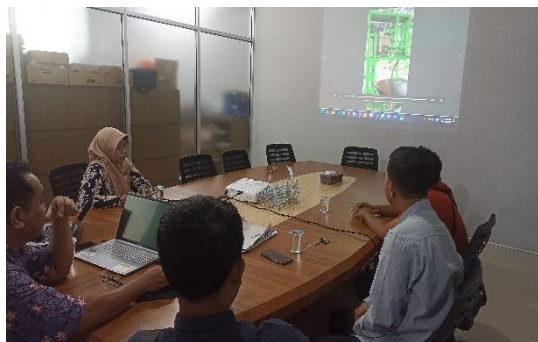
Gambar 3 : Koordinasi TTG dengan UKM

Keberlanjutan kegiatan kedua adalah dengan pendampingan penerapan manajemen usaha dan akuntansi keuangan, langkah penting untuk meningkatkan profesionalisme dan kinerja UKM Jenang Karomah dan UKM Jenang Menara. Melalui pendampingan ini, pelaku UKM mendapatkan bimbingan dalam mengatur struktur organisasi, merencanakan strategi bisnis, dan mengelola operasi sehari-hari secara lebih efisien. Pendampingan juga mencakup pelatihan intensif dalam akuntansi keuangan, di mana pelaku usaha diajarkan cara mencatat transaksi keuangan, menyusun laporan keuangan, dan melakukan analisis keuangan. Dengan demikian, mereka dapat memahami posisi keuangan bisnis secara lebih jelas dan membuat keputusan yang lebih tepat berdasarkan data akurat. Pendampingan ini juga melibatkan penggunaan teknologi akuntansi yang sesuai untuk memudahkan proses pencatatan dan pelaporan keuangan. Hasilnya, UKM Jenang Karomah dan UKM Jenang Menara dapat meningkatkan transparansi dan akuntabilitas keuangan,