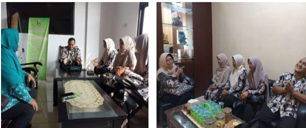
Gambar 1 : koordinasi dengan Dinas

Melalui sinergi yang baik, berbagai program pemberdayaan dapat diimplementasikan secara efektif, mulai dari peningkatan manajemen keuangan, adopsi teknologi tepat guna, hingga strategi pemasaran yang inovatif. Kerja sama ini juga memastikan bahwa bantuan yang diberikan tepat sasaran dan sesuai dengan kebutuhan pelaku UKM Jenang, sehingga mampu meningkatkan produktivitas, kualitas produk, dan daya saing di pasar lokal maupun nasional. Dukungan pemerintah daerah melalui dinas terkait menjadi kunci keberhasilan dalam mengembangkan Jenang sebagai produk unggulan yang mampu berkontribusi signifikan terhadap perekonomian Kabupaten Kudus dan nasional.