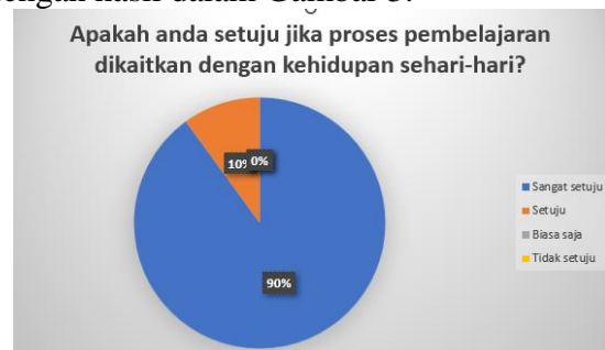
Gambar 3. Hasil Evaluasi Kegiatan

Kegiatan juga melalui pendampingan yaitu pendampingan dalam membantu tutor menyelesaikan permasalahan yang dialami selama kurun waktu yang telah ditentukan agar tujuan kegiatan tidak terkendala. Kegiatan pendampingan dilaksanakan melalui Whatsapp group dan pertemuan langsung. Hasil kegiatan dievaluasi melalui angket dengan hasil dalam Gambar 3.