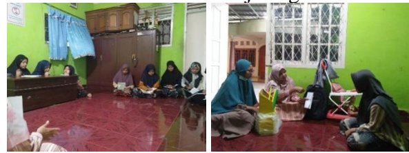
Gambar 2. Penjelasan Cara Penggunaan Kotak Berbahasa Inggris dan Indonesia oleh Tim Pengabdian

berbahasa Inggris dan tidak ditemukan juga dalam kotak berwarna kuning. Dalam kotak berwarna hijau para santri menuliskan Bahasa Indonesia yang kemudian hasil tulisan tersebut diterjemah dalam bahasa Inggris dengan bantuan para tutor dan hasil terjemahannya dimasukkan dalam kotak bantuan berwarna kuning. Kegiatan dilaksanakan selama dua bulan dengan tujuan tercapainya budaya lokal percakapan sehari-hari lingkungan santri, selama Ramadhan dan menjelang Idul Fitri.