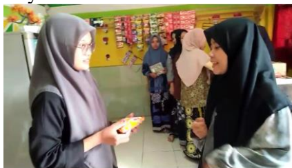
Gambar 1. Simulasi Pembelajaran Kontekstual Berbasis Kearifan Lokal

Kegiatan diawali dengan pelatihan yaitu tim pengabdian memberikan silabus yang telah disiapkan dan didiskusikan bersama tutor untuk kesesuaian materi yang dibutuhkan, kemudian mengajarkan materi dasar kepada tutor yang akan digunakan dalam konteks sehari-hari berbasis budaya lokal santri, Santri tutor diajak simulasi langsung untuk menggunakan percakapan dalam kehidupan sehari-hari di lingkungan kantin santri agar tutor bisa menerapkan penggunaan materi dengan berbasis kontekstual dalam kegiatan bersifat nyata dan mudah dicerna.