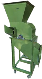
Gambar 3. Mesin Penghancur KOHE

mitra agar dapat mengoperasikan mesin sesuai dengan standar operasional prosedur (SOP) yang ada. Dengan menjalankan mesin sesuai SOP, maka efisiensi dan efektivitas dapat terwujud. Dalam pelatihan pengoperasian ini, unsur keselamatan dan kesehatan kerja (K3) juga akan disampaikan, agar kecelakaan akibat kerja dapat diminimalisasi sebanyak mungkin.