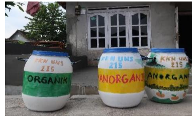
Gambar 2. Hasil Drum yang Sudah Dicat dan Dihias :

Kegiatan ini dilakukan pada Senin, 23 Agustus 2021 di Dukuh Gondang, Desa Siwal. Proses mendekorasi drum plastik ini bertujuan untuk mempercantik dan memperindah tampilan tempat sampah sehingga lebih menarik perhatian. Pada masing-masing pasang drum dituliskan identitas organik dan anorganik agar mempermudah masyarakat memilih dan membuang sampah di tempat yang tepat. Dekorasi warna dibedakan menjadi hijau untuk tempat sampah organik dan kuning untuk tempat sampah anorganik.