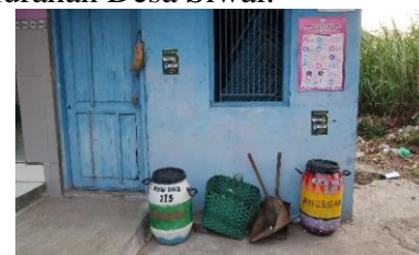
Gambar 3. Penempatan Tempat Sampah Organik dan Anorganik di Lokasi yang sudah Ditentukan Karang Taruna Desa Siwal

Kegiatan ini dilakukan setelah kegiatan dekorasi drum plastik pada hari yang sama. Dalam pelaksanaannya, kegiatan ini dilaksanakan di salah satu pos ronda bersama anggota karang taruna Dukuh Gondang, Desa Siwal. Sosialisasi dilakukan oleh Muhammad Argiadi Ramadhan selaku penanggung jawab program kerja. Sosialisasi disampaikan dengan penjelasan terkait sampah organik dan anorganik serta pentingnya untuk pemisahan kedua jenis sampah tersebut untuk lingkungan yang dibantu dengan visualisasi poster agar lebih mudah dipahami. Setelah melakukan sosialisasi pemisahan sampah, 4 pasang drum plastik yang terdiri dari 4 drum untuk tempat sampah organik, dan 4 drum untuk tempat sampah anorganik diserahkan kepada karang taruna untuk diletakkan di tempat-tempat strategis di desa. Adapun tempat strategis di Desa Siwal yang dimaksud di sini adalah Posyandu, Pos Ronda, Masjid di Desa Siwal, dan Kelurahan Desa Siwal.