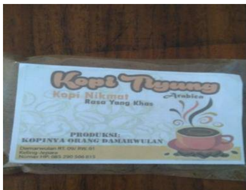
Gambar 8. Pemberian Label (Sesudah Tim IbM Datang)