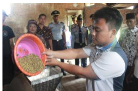
Gambar 6. Peserta Pelatihan Menuangkan Kopi yang Akan Disangrai