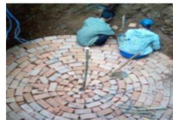
Gambar 2. Pembuatan Dasar Sumur ‘Biogas’

Faktor pendorong kegiatan yaitu narasumber memang ahli dibidang ‘bio gas’ dan antusiasme masyarakat yang ingin mendapatkan bahan bakar baru untuk memasak kopi yang ramah lingkungan. Sedangkan faktor penghambat yaitu jumlah sapi yang sedikit (hanya 10 ekor), sehingga pada awalnya harus mendatangkan kotoran sapi dari desa tetangga, serta belum adanya tenaga yang dapat membuat sumur ‘bio gas’ dan kelengkapannya, sehingga harus mendatangkan dari daerah lain.