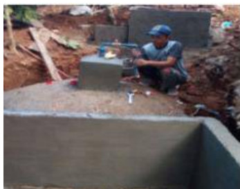
Gambar 3. Pembuatan Katup Pengaman Tekanan