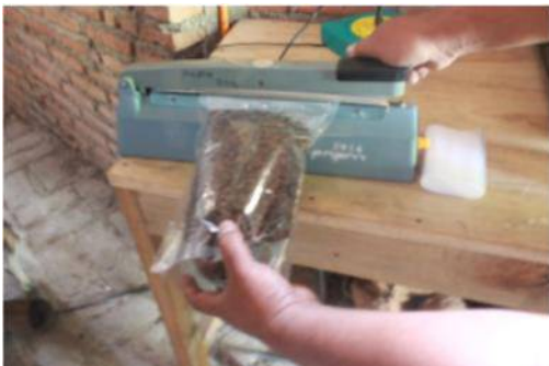
Gambar 7. Praktek Pengemasan ( Packaging )

‘labeling’ (pemberian label) dengan peserta yaitu anggota Kelompok Tani ‘Langgeng Makmur’. Pelaksanaan kegiatan ini pada Senin, 28 Agustus 2017 dengan narasumber PPL Desa Damarwulan. Materi pelatihan yaitu cara mengepak dan memberi label kopi yang baik.