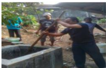
Gambar 4. Mengaduk Kotoran Sapi Dengan Air Agar Rata