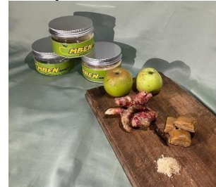
Gambar 5. Produk yang Selesai Dikemas

Serbuk halus yang dihasilkan dari proses pengayakan kemudian dikemas dalam wadah berbahan plastik. Pemilihan kemasan dalam wujud stoples dimaksudkan agar produk tahan akan pengaruh suhu dan cuaca sehingga tidak mudah menggumpal dan berubah rasa. Gambar 5 menunjukkan kemasan serbuk minuman kulit apel.