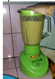
Gambar 2. Proses Pencampuran Semua Bahan

Tahap kedua adalah pemilihan bahan-bahan campuran olahan wedang dan permen kulit apel. Pada tahap ini beberapa bahan seperti kayu manis, jahe, gula merah, dan lain-lain mulai dikumpulkan. Selanjutnya melakukan pembersihan dan pengupasan terhadap beberapa bahan.