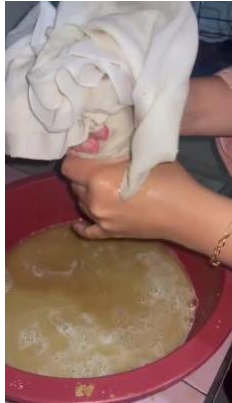
Gambar 3. Proses Penyaringan Sari Kulit Apel

Tahap keempat adalah melakukan penyaringan. Pada tahap ini dilakukan proses penyaringan terhadap semua bahan yang sudah diaduk dalam blender. Proses penyaringan bertujuan untuk memisahkan antara ampas dengan sari bahan campuran kulit apel dan bahan-bahan lain. Gambar 3 mengilustrasikan proses ini.