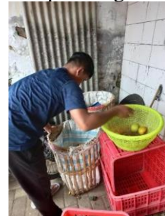
Gambar 1. Proses Penyortiran Apel yang Afkar

Tahap demonstrasi diperagakan oleh salah satu anggota tim PKM UNISMA yang berasal dari salah satu pengajar di Fakultas Pertanian UNISMA yang dibantu oleh beberapa mahasiswa. Tahap demonstrasi terdiri dari beberapa tahap, 1) tahap penyortiran, pada tahap ini dilakukan dengan memilih apel yang tidak layak dijual. Gambar 2 mengilustrasikan seorang mahasiswa sedang memilah apel dengan kualitas afkar.