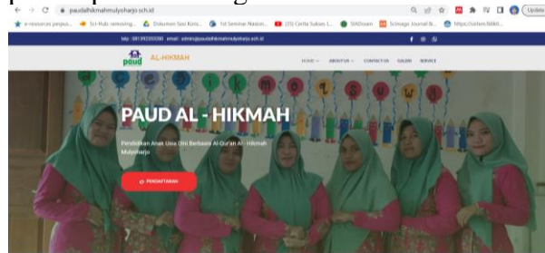
Gambar 4. Tampilan Website Sekolah

mereka paham terhadap komponen yang ada pada laporan keuangan sekolah.