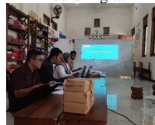
Gambar 2. Pengelolaan Administrasi Keuangan Sekolah