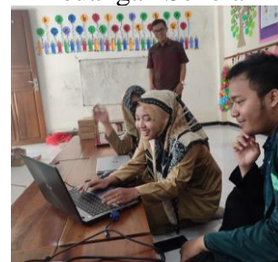
Gambar 3. Praktikum Pelatihan Pengelolaan Keuangan Sekolah

Pelatihan pengelolaan keuangan sekolah selain teori juga ada praktik sesuai Gambar 3. Peserta didampingi mahasiswa tujuannya agar