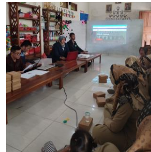
Gambar 1. Pelaksanaan Sosialisasi Promosi Media Digital

Setelah kegiatan sosialisasi penerapan media promosi digital berbasis website , dilanjutkan pelatihan pengelolaan keuangan sekolah yang bertujuan untuk meningkatkan keterampilan guru dalam mengelola keuangan sekolah yang awalnya dilakukan secara manual dengan mencatat kas masuk dan kas keluar dengan tulisan tangan yang dicatat di buku biasa (Gambar 3). Sehingga dapat mengakibatkan data hilang, selisih dana. Pelatihan ini dilaksanakan pada tanggal 7 September 2022 diselenggarakan di sekolah KB/TK Al Hikmah Mulyoharjo. Pada pelatihan ini disampaikan oleh Bapak Sarwido, S.E., M.M. yang ahli di bidang pengelolaan keuangan. Untuk praktiknya didampingi oleh Maulana Hadi dan Aurelia Putri.