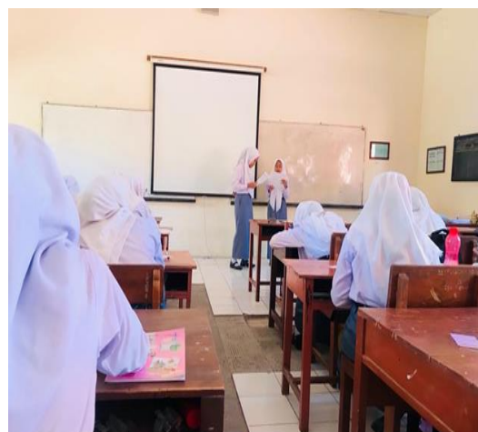
Gambar 5. Siswa saat membacakan hasil ringkasannya.

Asesmen lisan ketika siswa menyampaikan materinya berbicara.