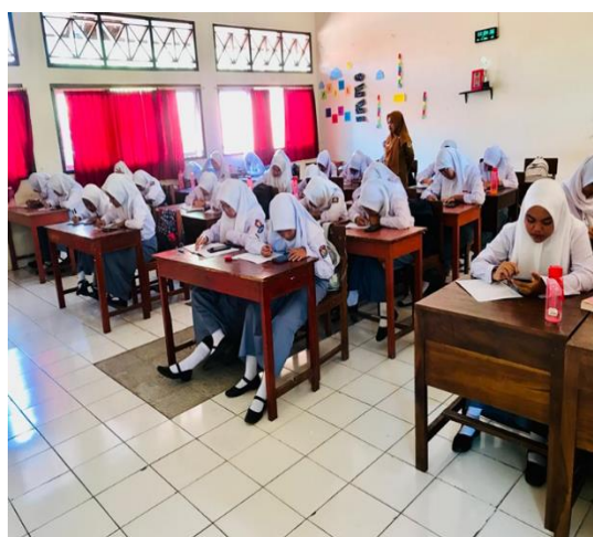
Gambar 3. Siswa meringkas materi yang diberikan guru.

senang dan aktif dalam mengikuti pembelajaran dan Siswa memperhatikan dan mengikuti pembelajaran dengan baik.