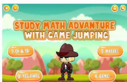
Gambar 2. Tampilan Menu Game Smart Jumping

Pada bagian ini adalah inti dari aplikasi. Menu yang disediakan tertera dalam layout menu. Terdapat menu profil, petunjuk penggunaan, pengaturan back sound , tes awal, capaian dan tujuan pembelajaran, materi dan game .