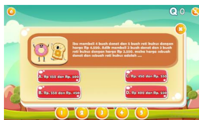
Gambar 3. Tampilan Tes Awal Game Smart Jumping

Pada bagian ini terdapat 5 soal yang disediakan untuk siswa sebagai pretest . Soal yang disediakan untuk siswa harus dikerjakan sebelum siswa belajar menggunakan game smart jumping . Soal disesuaikan dengan materi sistem persamaan linier dua variabel.