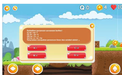
Gambar 5. Tampilan Game Smart Jumping

Pada bagian ini terdapat, petunjuk game , tombol back sound game , tombol silang guna kembali ke menu, dan pemilihan level game . Game smart jumping menyediakan 3 level. Untuk setiap level disajikan, 10 nyawa pemain, 5 soal sebagai posttest siswa yang disesuaikan dengan materi sistem persamaan linier dua variabel, dan jumlah musuh dengan berdasarkan tingkat kesulitan soal dan permainan yang berbeda. Siswa diharuskan untuk mengumpulkan koin dan mengerjakan soal. Game over akan muncul apabila siswa tidak dapat menyelesaikan permainan dikarenakan nyawa habis atau kurang dari 1. Level complete akan muncul apabila siswa dapat menyelesaikan permainan dan mengerjakan 5 soal.