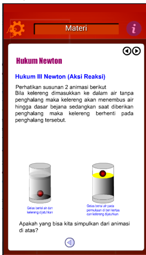
Gambar 3. Contoh tampilan pemodelan dalam media

Validasi produk multimedia yang dikembangkan melibatkan 4 orang ahli materi, 2 orang ahli media. Tujuan dari validasi adalah untuk mendapatkan penilaian dari ahli-ahli yang berkompeten dalam pengembangan multimedia, selain itu untuk mendapatkan masukan-masukan agar multimedia yang dikembangkan menjadi lebih baik. Adapun hasil revisi multimedia setelah di validasi, tampilannya diantaranya ada pada gambar 3 dan gambar 4.