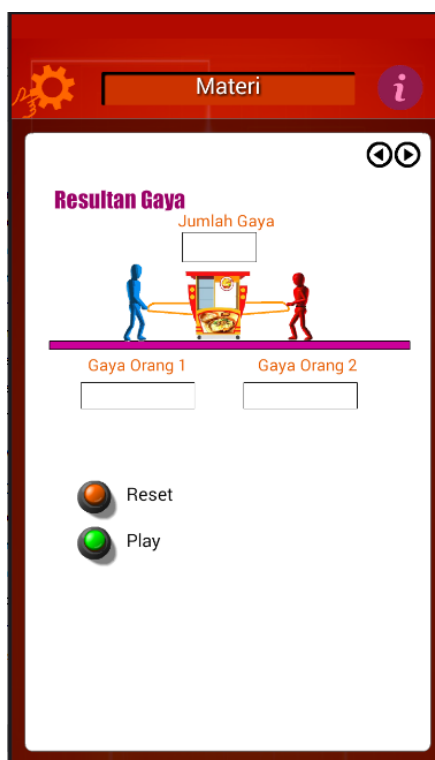
Gambar 4. Contoh tampilan inquiry dalam media

Hasil yang diperoleh dari ahli materi menunjukkan bahwa skor rata-rata multimedia yang dikembangkan secara keseluruhan adalah 82,50 (82,5% dari skor ideal). Berdasarkan perhitungan, multimedia berbasis mobile yang telah disusun menurut ahli materi memiliki skor 82,50 dengan kriteria baik (B). Data hasil validasi ahli materi disajikan oleh tabel berikut.