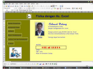
Gambar 1. Halaman Pembuka