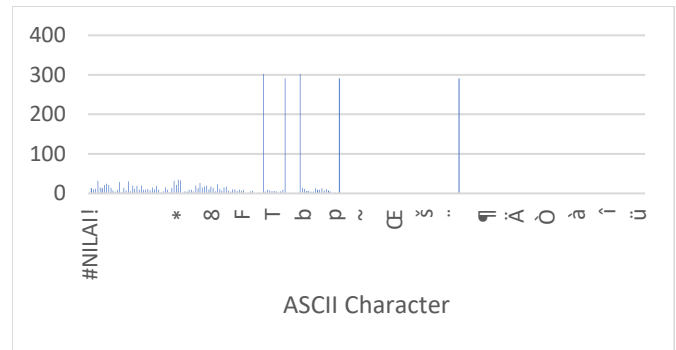
Gambar. 2. Histogram karakter cipherteks hasil ECR.

dari printable karakter ASCII. Random key dipilih dengan menggunakan fungsi random pada nomor indeks tabel permutasi, yang kemudian dikonverisikan pada angka Random key sesuai indek. Hasil yang didapatkan ialah bahwa sebaran karakter pada ciphertext lebih merata. Tidak ada penggunaan karakter yang terlalu menonjol. Gambar 3 memperlihatkan sebaran karakter pada ciphertext dari eksperimen ini. Dengan sebaran karakter yang lebih merata,