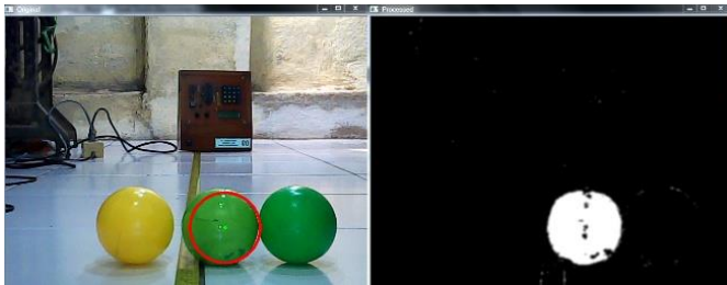
Gambar 2. Hasil konversi RGB ke HSV

Pada tahap ini gambar yang ditangkap oleh kamera dalam format RGB kemudian dikonversi ke bentuk HSV untuk mendapatkan pola gambar biner, yaitu hitam dan putih. Pola putih adalah objek yang dideteksi dan lainnya dianggap sebagai background sehingga diatur berpola hitam. Gambar 2 adalah hasil konversi gambar format RGB ke HSV.