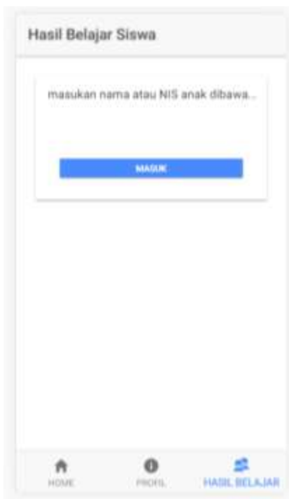
Gambar 4. Tampilan User orang tua

Tampilan ini digunakan oleh orang tua siswa untuk memantau hasil belajar anak serta permasalahan dalam belajar siswa, misalkan siswa masih kurang memahami pelajaran matematika, ipa ataupun ips. Diharapkan orang tua mampu membimbing siswa, berikut ini, tampilan user orang tua wali siswa yang dapat dilihat pada gambar 5.