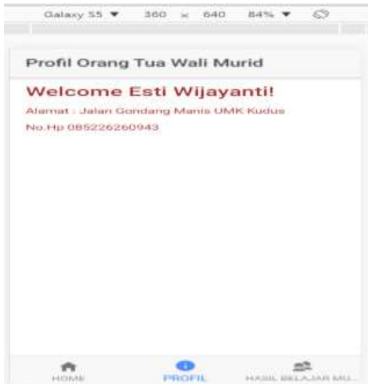
Gambar 4. Tampilan orang tua wali murid

Tampilan ini digunakan oleh orang tua siswa untuk memantau hasil belajar anak serta permasalahan dalam belajar siswa, misalkan siswa masih kurang memahami pelajaran matematika, ipa ataupun ips. Diharapkan orang tua mampu membimbing siswa, berikut ini, tampilan user orang tua wali siswa yang dapat dilihat pada gambar 5.