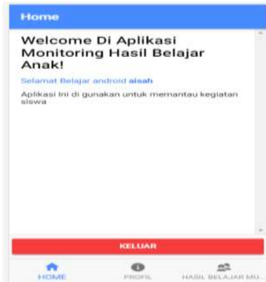
Gambar 3. Tampilan User

Aplikasi penelitian ini digunakan dan bangun dengan menggunakan bahas pemrograman android yang menghasilkan aplikasi monitoring hasil belajar anak. Berikut ini adalah user interface pada halaman home dapat dilihat pada gambar 3.